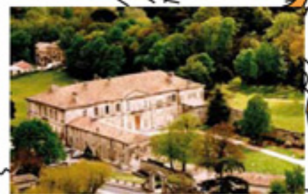
Hôtel de Ville n°8