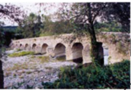
Pont Romain n°1