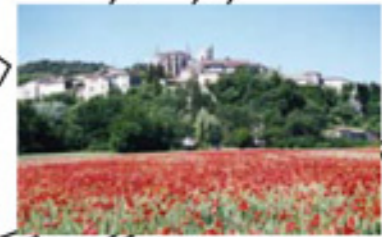
Viviers, vue du Rhône