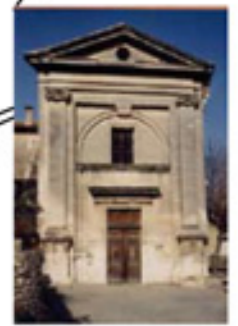
Notre Dame du Rhône n°12