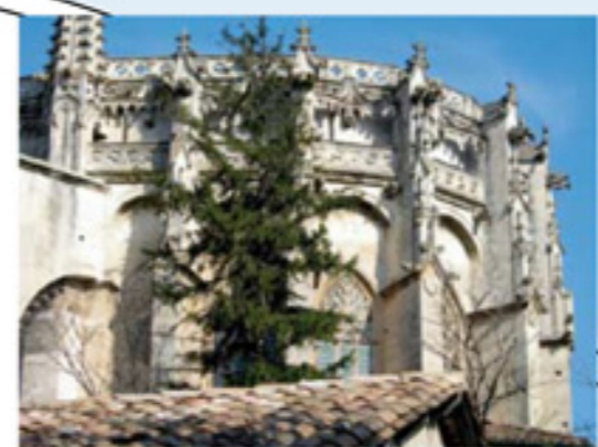
La Cathédrale n°6