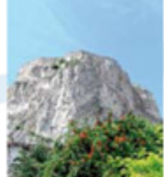
Rocher de Châteaueux n°2