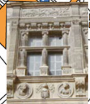
Maison des Chevaliers n°7