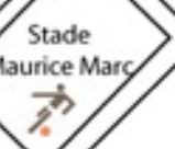
Stade Maurice Marc

Vers Châteauneuf Montélimar Autoroute A7